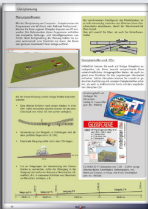
Bildleiste oben: Von der Planung, über den Anlagenbau bis hin zu Tipps und Tricks – dies alles bietet Ihnen unser neues Ratgeberheft.

Beim Aufbau einer Modellbahnanlage wird man schnell mit der Elektrotechnik konfrontiert. Es werden dann verschiedenste Fragen aufkommen: Wie erweitere ich die Anlage auf zwei oder drei Fahrkreise? Was muss ich bei der Spannungsversorgung beachten? Was benötige ich für einen automatischen Fahrbetrieb? ... usw. Da jeder Modellbahner eigene Vorstellungen von „seiner“ Modellbahnanlage hat, haben wir auf diesen Seiten einige wiederkehrende Schaltungsbeispiele einer konventionell betriebenen Modellbahnanlage zusammengestellt.